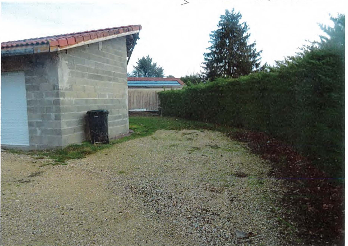
Facade West Extension