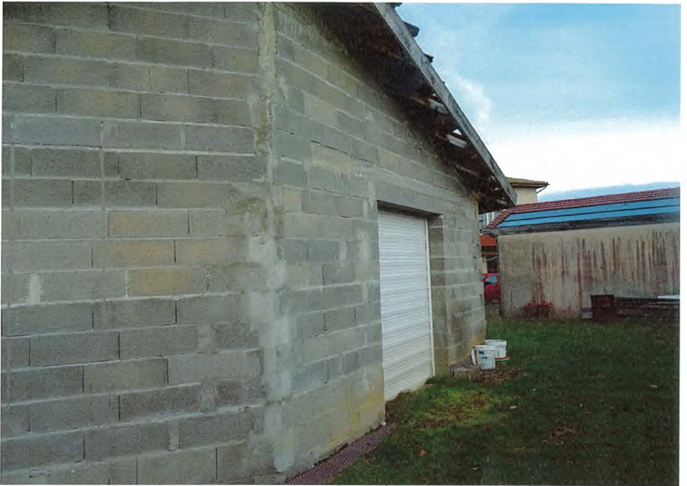
Facade East Extension