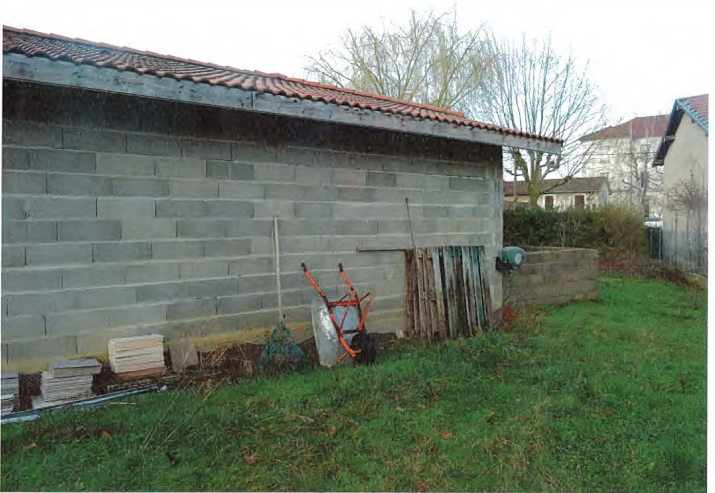
Facade Ouest exterior